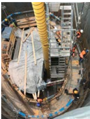
Herstellung Innenschale im Gleitschalungsverbau