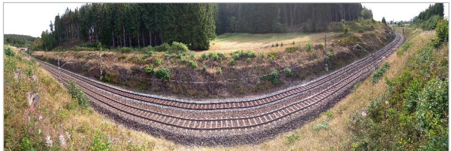
Panoramafoto des Sicherungsbereiches (Weitwinkelleffekt - optisch verzerrt)

Die Entwurfsvermessung der Böschung inklusive Dokumentation und Vermessung der Entwässerungsanlagen erfolgten durch das Vermessungsbüro Leibiger aus Kesselsdorf / Dresden im Unterauftrag von IBES. Die vom Vermessungsbüro erstellten Pläne mit hinterlegtem digitalem Geländemodell und generierten Querprofilen dienten als Grundlage für die Planung der FHS-Maßnahme.