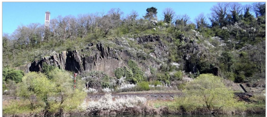
Beispielfoto eines Sicherungsbereiches bei Runkel an der Lahn

Während der Baumaßnahmen wurden die Projekte durch IBES als Geotechnische Fachbauleitung betreut.