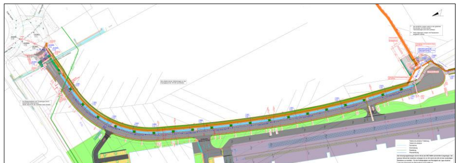
Abbildung 1 Lageplan 1. BA

Die Planungs-, bauvorbereitenden und bauüberwachenden Arbeiten wurden durch die Wasser Umwelt Verkehr GmbH erbracht. Gleichzeitig wurden alle Versorgungsme- dien, Gas, Wasser, Strom, Telekommunikation eingebracht. Für die Entsorgung musste ein Niederschlagswassersystem von ca. 1,0 km Länge bis zum nächsten Vor- fluter (Afferder Bach) errichtet werden. Zur Schmutzwasserentsorgung wurde ein Schmutzwasserkanalisationssystem mit Schmutzwasserpumpwerk und Druckrohrlei- tungen zum öffentlichen Mischwasserkanalsystem errichtet. Zur Vorklärung des klär- pflichtigen Niederschlagswassers wurden Mulden- Rigolensysteme errichtet.