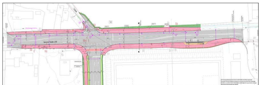
Abbildung 2 Neuer signalisierter Knotenpunkt mit barrierefreien Bushaltestellen